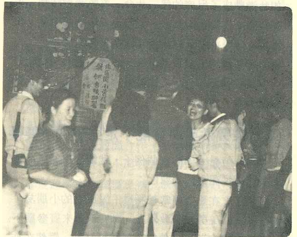
• 北區國小資優班教師自強研習及外埠參觀 •