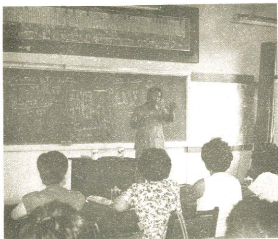
毛局長：特教專題演講