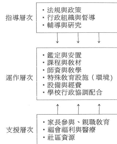
圖二：特殊教育實施要件架構圖

2. 行政組織與督導：我國教育行政組織為三級制，中央為教育部，省及院轄市為教育廳（局），地方為縣市之教育局。關於特殊教育設施的設置、特殊教育經費的編列，皆由行政單位負責規劃，再委交所屬學校辦理特殊教育業務，行政單位並負責督導的責任。